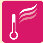
温度差エネルギー利用