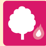
バイオマス熱利用