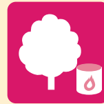
バイオマス燃料製造

熱利用設備 再生可能エネルギー由来の熱を有効利用する熱利用設備を導入する事業者が対象。 熱を利用する区域・用途に占める再生熱の割合(再エネ率)が10%以上、または再生熱の年間総発熱量200GJ以上の設備。