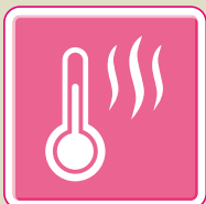
温度差エネルギー利用