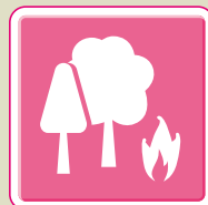
バイオマス熱利用