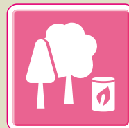
バイオマス燃料製造