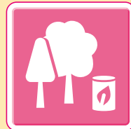
バイオマス燃料製造