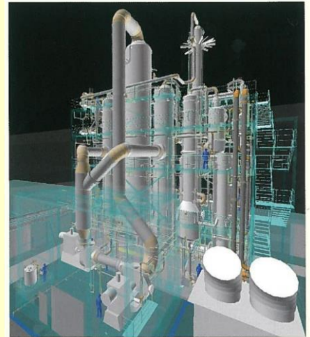
※蒸留塔にMVR技術を適用したハイブリット型の省エネルギー蒸留システム