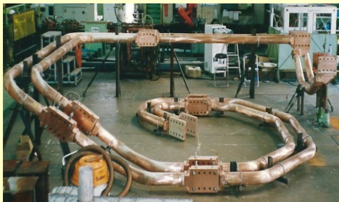
図1 ターンコイル（陽極側導体）

当社は直流型アーク炉に独自設計のターンコイルを取り付け、高い評価を得てきた。近年、それらの稼働実績が評価されて他社製の直流炉にもターンコイルを取り付ける改造工事を行い、改めてその攪拌効果が実証された。既に2事業所での改造実績があり、ターンコイルの導入によりいずれも電力および電極原単位の削減など、溶鋼攪拌能力UPによる操業改善効果が得られている。図1はターンコイルのキーデバイスである陽極側導体の外観である。図2はターンコイルの取付例であり、直流型アーク炉の底部を下から見上げた構図である。ターンコイルは絶縁処理されたサポートによってアーク炉の炉底にぶら下がるように取り付けられる。そしてターンコイルを通して炉底電極へと電力を供給している。