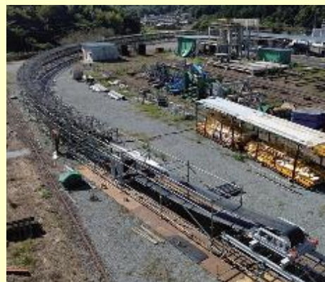
図2 フリーラインコンベヤ