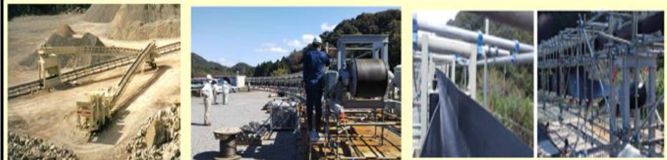
図5 電動式破砕機、フリーラインコンベヤ写真