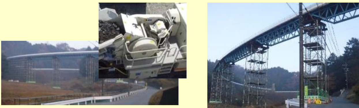
図6 A社納入、稼働中の電動破砕機、フリーラインコンベヤ写真