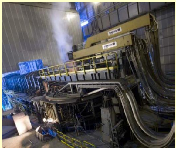
電気炉・電極アーム