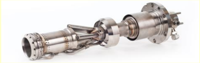
乾式低エミッション（DLE）燃焼器

下図は本設備ラインナップの一つであるSGT-800を示したものである。 その他のラインナップについては当社ホームページ（英語）を参照のこと。 https://www.siemens-energy.com/global/en/home/products-services/product/sgt-800.html