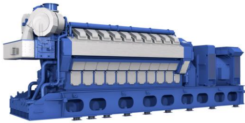
図1 ガスエンジン外観 (W20V34SG)