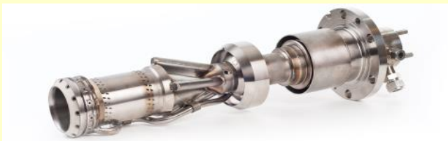
乾式低エミッション（DLE）燃焼器

下図は本設備ラインナップの一つであるSGT-800を示したものである。 その他のラインナップについては当社ホームページ（英語）を参照のこと。 https://www.siemens-energy.com/global/en/home/products-services/product/sgt-800.html