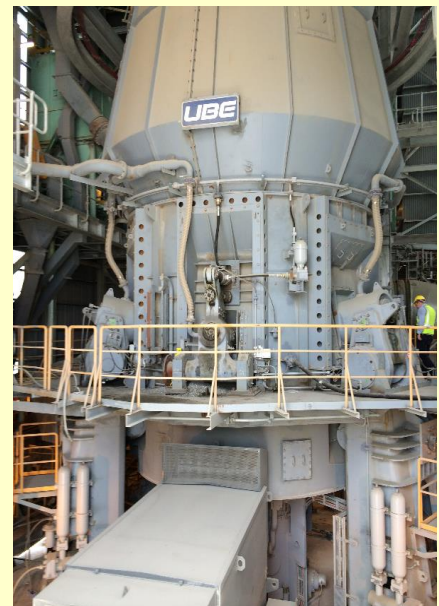
オーストラリア納入 / UM43.6SCR UBE縦型ミル