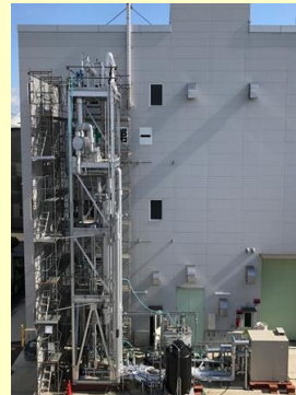
木村化工機尼崎工場内の実証実験装置