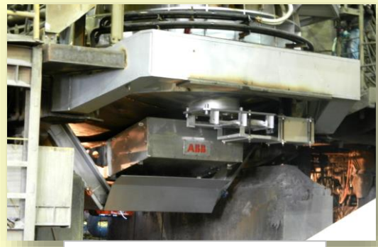
ArcSaveシステム導入前後性能評価テスト結果