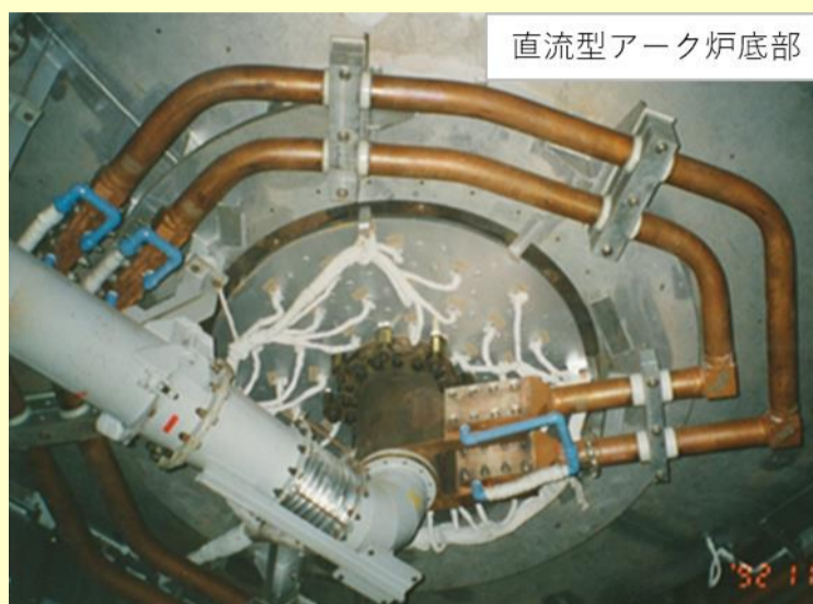
図2 ターンコイル取付例