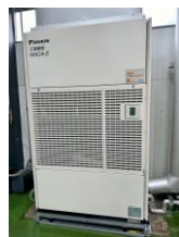
空調設備（室内機、室外機）