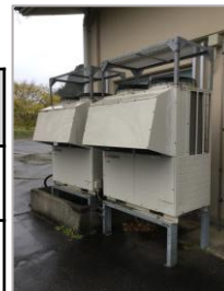
ヒートポンプユニット