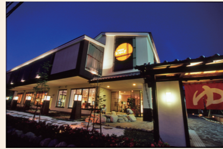
源気温泉八尾おゆば外観

http://tsurukame-oe.xsrv.jp/tsurukame/ 大阪府八尾市 / 生活関連サービス業、娯楽業