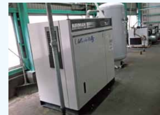
2. インバータ制御コンプレッサー 吐出量 6.9m³/min. 吐出圧 0.8MPa