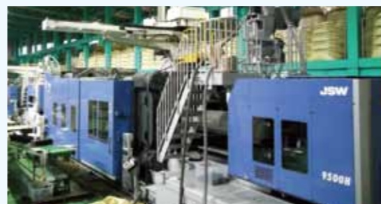
1. 電動式射出成形機 (1,800t、1,300t、180t、100t)