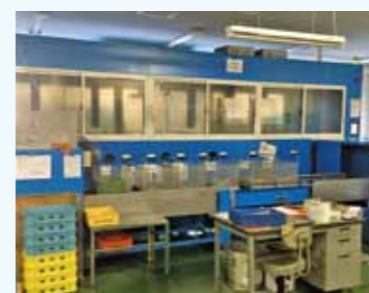
1. 炭化水素洗浄システム洗浄機 1カゴ当たりのC/T約170秒