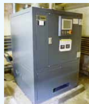
4. 高効率ブロワ 風量47.8m 3 /min.以上 吐出圧力53.9kPa以上