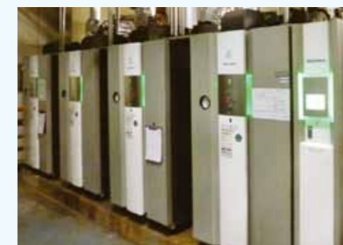
2. LNG高効率ボイラ 2t/h, 1.5t/h、ボイラ効率98%