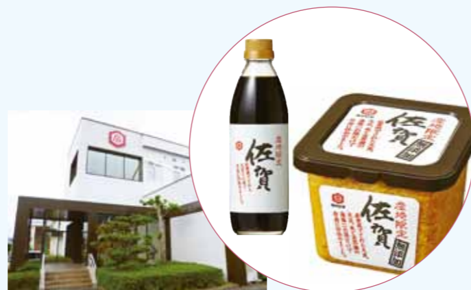
宮島醤油 妙見工場

宮島醤油は醤油・味噌を作り続けて130余年。妙見工場では、粉末食品やレトルト食品など3,000種類以上の食品を生産しています。粉末食品を製造する第1工場とレトルト食品を製造する第2工場、冷凍食品を製造する第3工場において食料品製造に必要なコンプレッサー、ボイラ、ブロワ等の複数のユーティリティ設備を高効率な設備に入れ替えた複合型の省エネルギー事業です。