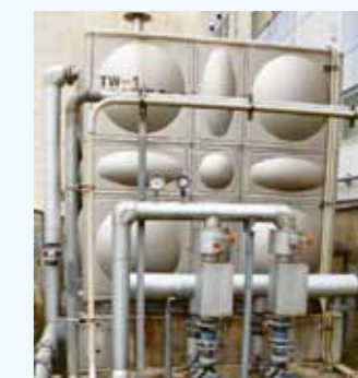
3. 温排水熱回収設備 (温排水タンク)