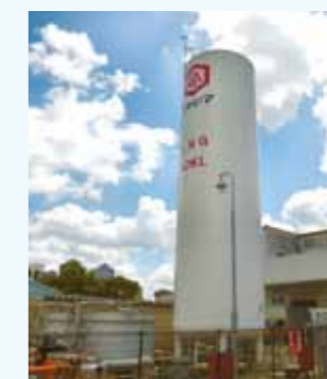
5. LNGサテライト設備 (貯槽60kL)