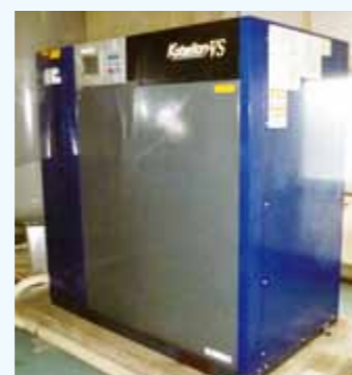
1. インバータ式コンプレッサー 吐出量6.55m 3 /min.以上、吐出圧0.7MPa