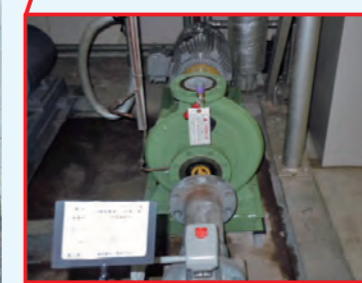
1-1. インバータ式ターボ冷凍機 1,548kW (500USRt) 1-2. 冷却塔 1-3. 冷水一次ポンプ