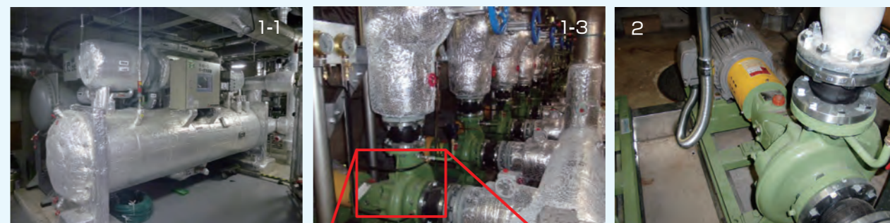
2. インバータ式温水ポンプ