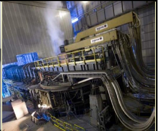
電気炉・電極アーム