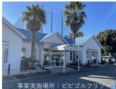
事業実施場所：ピピゴルフリゾート

弊社が経営するゴルフ練習場 ピピゴルフリゾートでは、令和2年度省エネ補助金を利用して、ゴルフボール搬送設備を更新し、制御方式の見直しとモーターの省電力化を行い、併せて照明のLED化によって事業所全体の省エネルギー化を図りました。