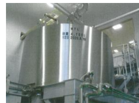
マッシュタンロイテル：1台 最大容量：6kℓ