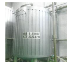
3番麦汁受付タンク：1台 容量：3kℓ