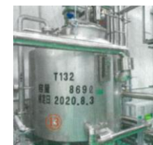
酵母タンク：2台 容量：600ℓ