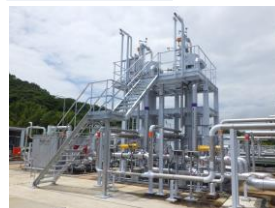
ブライン式LNG気化器2台 LNG気化能力：3t/h