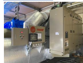
ターボ冷凍機3台 冷凍能力：2,210kW/600USRT