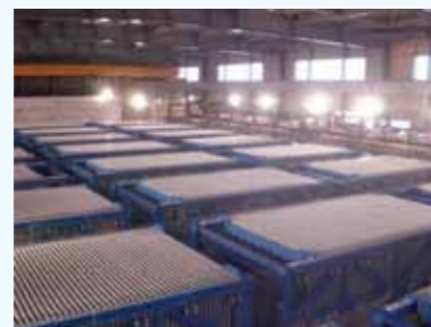
1. 複極式電解槽 イオン交換膜（自社開発の低抵抗膜 Flemion_F8080）