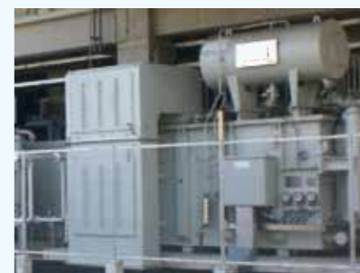
2. 整流器 整流効率の良い低電流高電圧タイプ