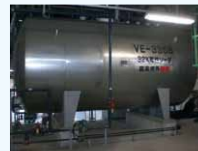
3. 陰極液受槽 圧力30～40KPaG (3,000～4,000mm水柱)