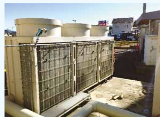
1. インバータ式冷凍機 冷凍能力 250.21kW