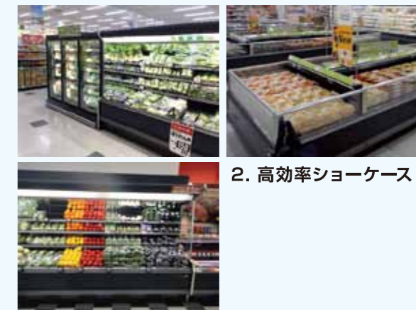
2. 高効率ショーケース