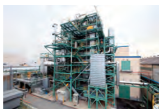
バイオマスボイラー発電設備

今後は他の工場に本事例の展開をするなど、会社全体で省エネに取り組んでまいります。