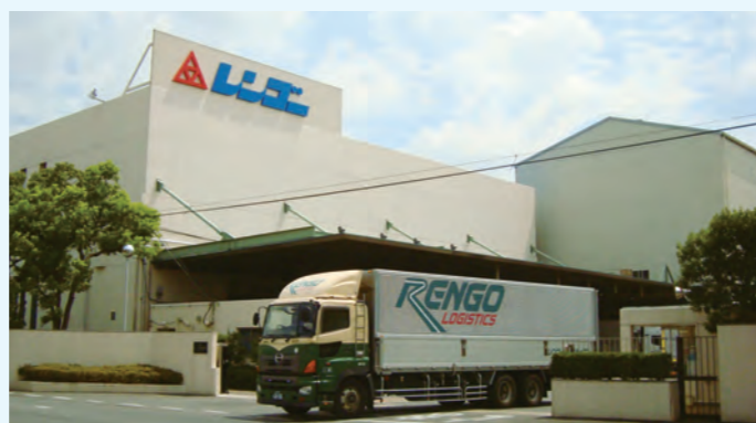
レンゴー八潮工場

八潮工場は昭和39年より操業を開始し、段ボール製造に必要な板紙生産量では国内最大の工場として稼働しています。八潮工場では早くより都市ガスへの燃料転換等、CO 2 排出削減に努めてきましたが、平成21年度の埼玉県地球温暖化対策推進条例施行により、更なる省エネルギー・CO 2 削減の推進が急務となりました。そこで原料から板紙を作る1号抄紙機（しょうしき）では湿紙から水を極限まで搾り出す最新型の高効率シュープレスを導入し、乾燥工程で使用する蒸気の使用量を大幅に削減しました。