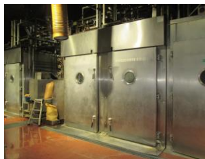
スモークハウス：1台 高圧蒸気0.5MPa 低圧蒸気0.05MPa