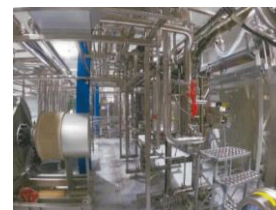
キャップ殺菌機：1式 仕様：18.4kW 900本/min