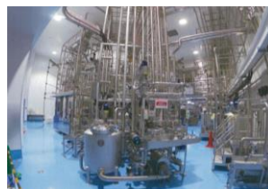
充填機ブロック：1式 仕様：138.9kW 900本/min