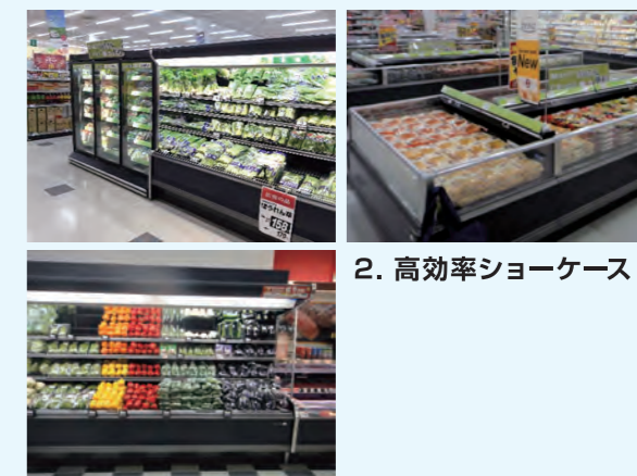
2. 高効率ショーケース