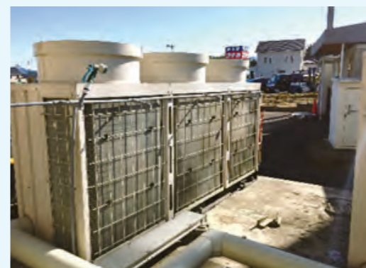
1. インバータ式冷凍機 冷凍能力 250.21kW