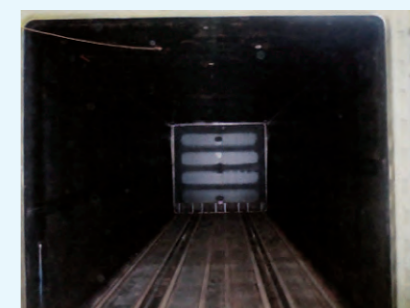
1. 高圧殺菌釜 (内部写真) 収容本数 5,000本 サイズ 1900H×1800W×4560L