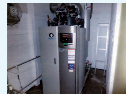
2. 蒸気ボイラ 相当蒸発量 500kg/h、 燃焼効率 95% 薬注装置、給水タンク、軟水装置 含