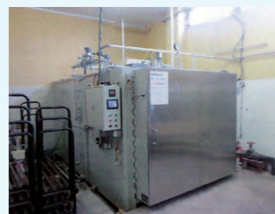
1. 高圧殺菌釜 (外観) 制限圧力 0.13MPa 自動運転装置組込