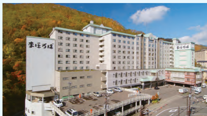
登別温泉ホテルまほろば

4種類の泉質と露天風呂を含めた全31種のお湯を巡ることができる宿泊施設です。施設内で最も消費量の多いA重油の削減のため、施設内の未利用エネルギーである温泉排湯と冷房排熱を有効活用する高効率ヒートポンプを導入。排熱を利用して給湯や空調、ロードヒーティングの加温に利用しました。また合わせてポンプのインバータ化により、さらなる省エネルギー化を図りました。