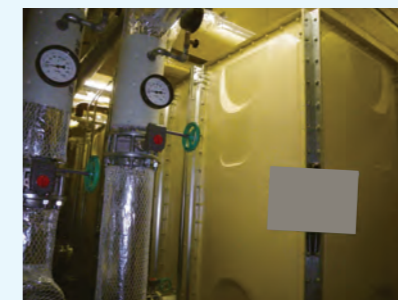
2. 蓄熱槽 容量 48m 3