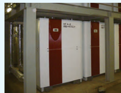
1. 水熱源ヒートポンプチラー 冷房能力 108.5kW